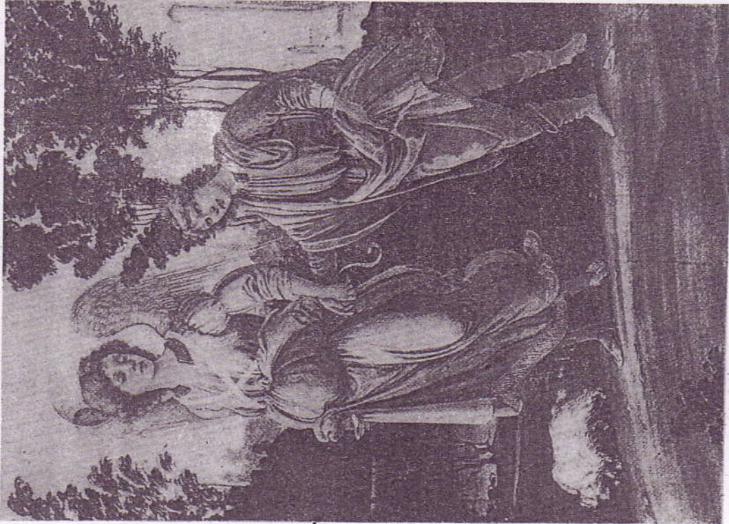
(Fragment: Aadama ja Eeva paradiisist väljaajamine) Filippo Lippi TOOBIJA JA INGEL